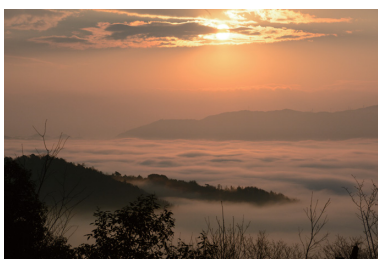
被朝霞渲染的雲海也是絕佳景色。可別忘了帶著相機來拍日出的照片哦。