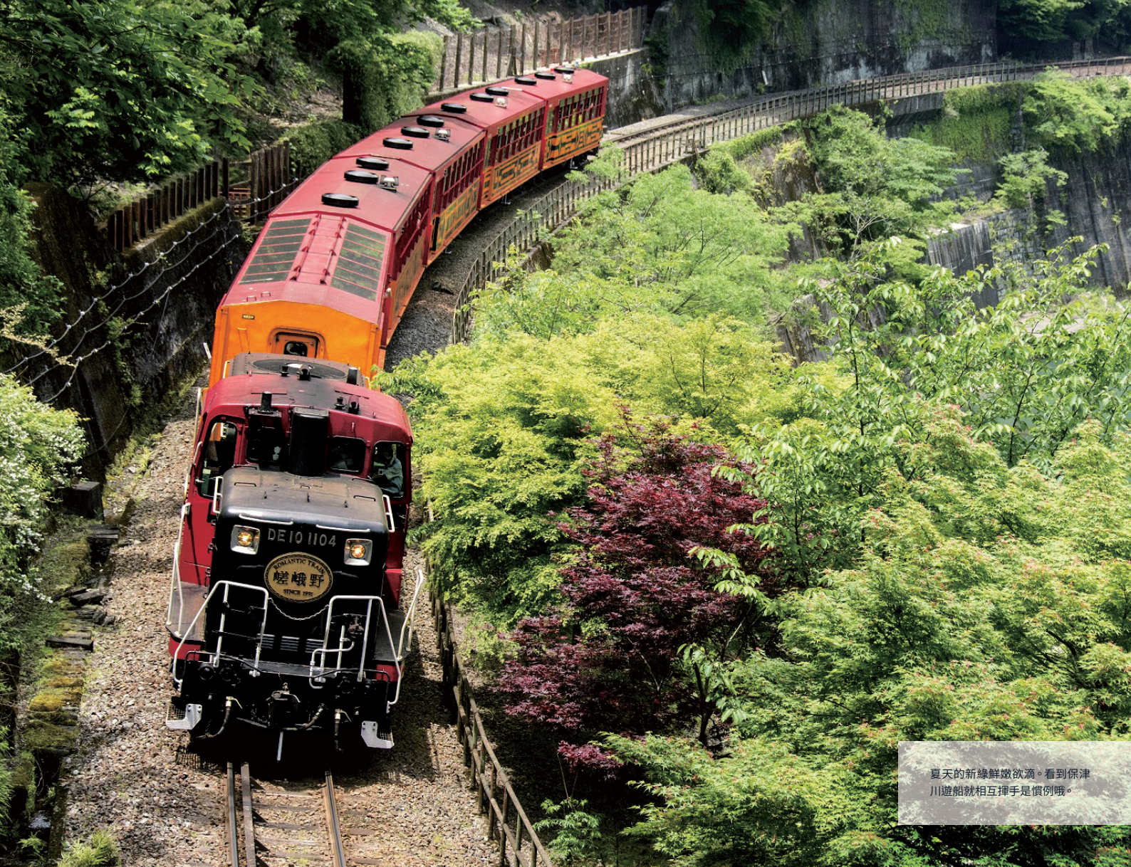
夏天的新綠鮮嫩欲滴。看到保津川遊船就相互揮手是慣例哦。