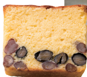
Haicots Village洋菓子店鋪新開張。使用了和三盆糖的黑豆蛋糕一條2160日元。