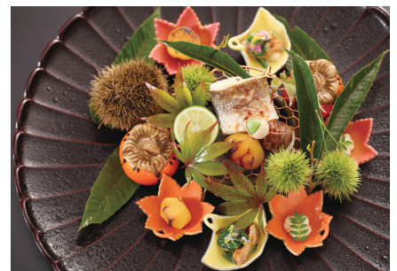
季節感十足，色彩繽紛的料理。請配著料理長精選的日本酒或者葡萄酒一起品嚐。