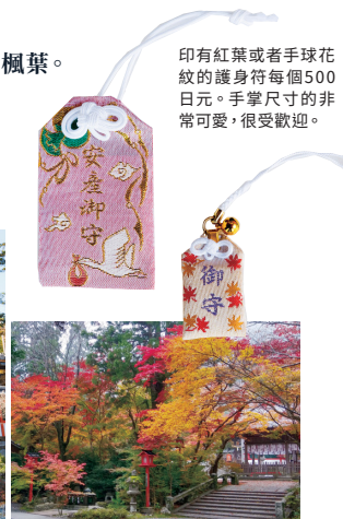
印有紅葉或者手球花紋的護身符每個500日元。手掌尺寸的非常可愛，很受歡迎。