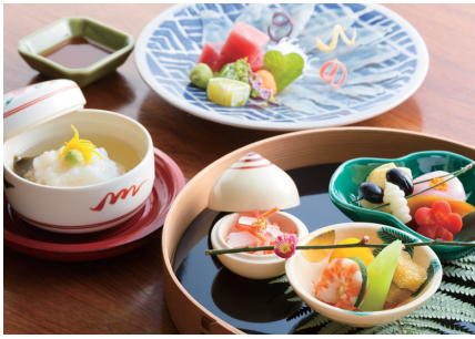
春天吃竹筍，夏天吃鱈魚和鮎魚，秋天吃松茸，冬天吃螃蟹和河豚。當地產的大米也很美味。