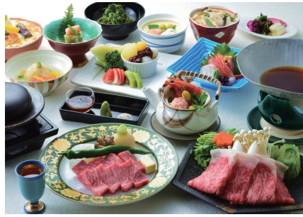
龜岡盆地夏季冬季溫差很大，正因為在最嚴厲的環境下，所以龜岡牛蒡壯成長後味道別具一格。