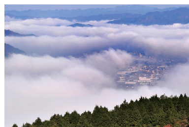
接近中午的時候濃霧會慢慢散開。從觀霧天台可以眺望龜岡街景。