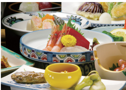
店主推薦的會席料理精選本地的時令素材。料理都需要預約。

☎0771・22・0903 IN15:00/OUT10:00 無休息日 P50輛 http://www.syoenso.com/