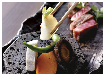
[石窯餐廳HANARI] 提供的石窯料理，外脆內鮮。