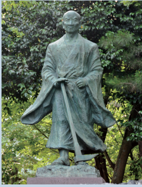
佇立在嵐山公園的龜山地區內的銅像

角倉了以是出生於嵯峨的富商，是開拓保津川之人。1606年，他僅用了6個月開通了難關重重的丹波～京都間的水路，從此實現了木材、米和薪炭等物資的大量運輸，為丹波地區的發展作出了重大的貢獻。