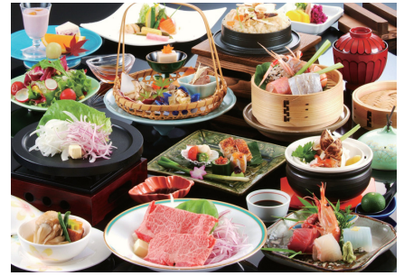
會席料理精選丹波牛，海鮮市場直運的魚貝類，上等的山珍海味。